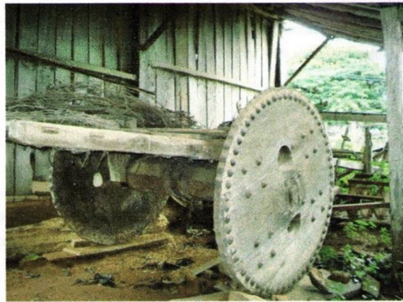
Foto 02: Carro de Boi - Vista lateral Data: 07/02/2007