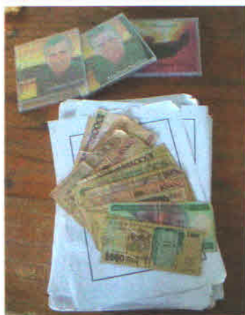
Foto 1: Conjunto do acervo guardado por Hailton. Data: Dezembro/2011.